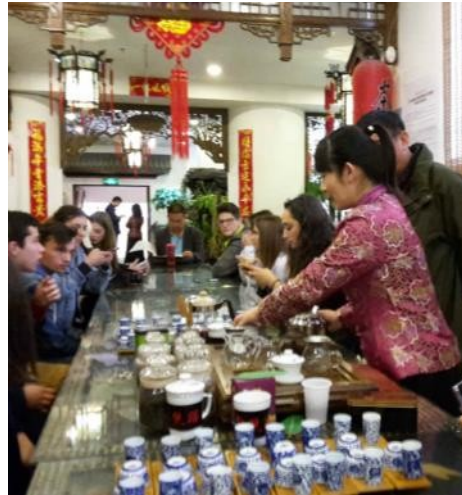
Dégustation de thé