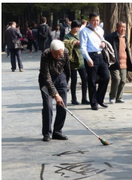
Écriture au pinceau à l'eau : exercice physique alliant le corps et l'esprit

Promenade au Palais d'été, ancienne résidence d'été des empereurs Ming et Qing, devenu jardin en 1924. Dans ce lieux de 2,9km 2 se trouvent un immense jardin, le lac Kunming, la colline de la Longévitité, le pont aux dix-sept arches, le Long corridor, les appartements impériaux, etc.