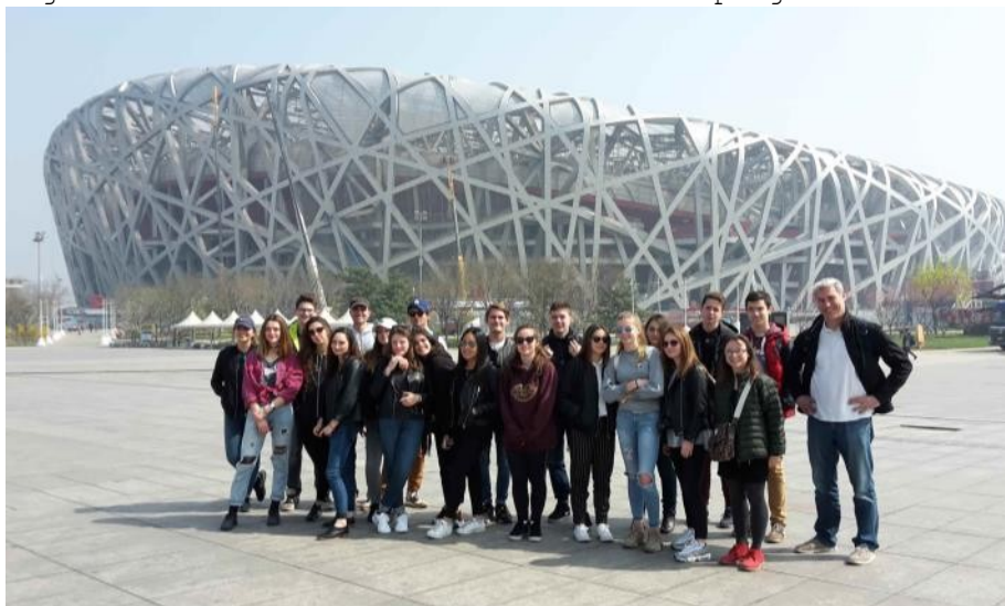
Le « nid d'oiseau », stade olympique (JO d'été 2008)

C'est le 5 avril que 20 élèves, accompagnés de deux professeurs se sont envolés pour la Chine. Chaque jour de nombreuses visites étaient au programme.