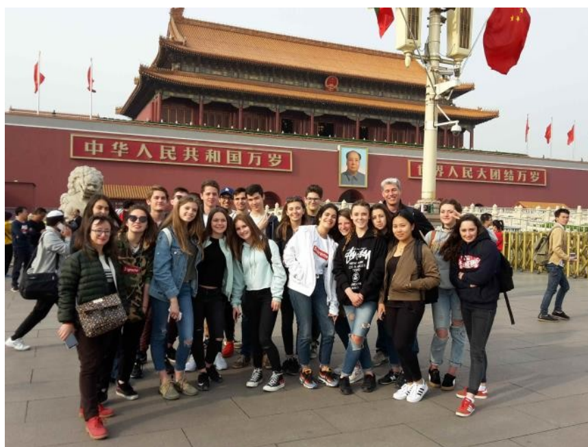
Le groupe devant Tian anmen («Porte de la paix céleste ») sous le portrait du premier président chinois, Mao Zedong.

C'est de cette porte que le président Mao Zedong a prononcé son discours lors de la fondation de la République Populaire de Chine (RPC) et c'est également du haut de cette porte que chaque année le président chinois prononce son discours pour célébrer la fête nationale, le 1er octobre.