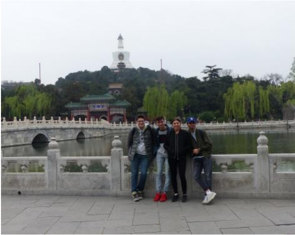
Le parc Beihai et tout au fond une stupa (ou dagoba) construite en 1651 en l'honneur de la visite du Ve Dalai-lama