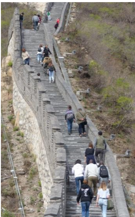
Ascension de la Grande muraille