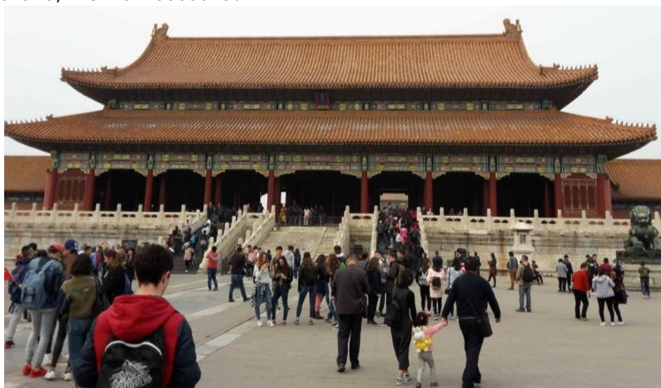
Découverte de la Cité interdite, résidence des empereurs dès 1406 (superficie de 72ha)

C'est de cette porte que le président Mao Zedong a prononcé son discours lors de la fondation de la République Populaire de Chine (RPC) et c'est également du haut de cette porte que chaque année le président chinois prononce son discours pour célébrer la fête nationale, le 1er octobre.