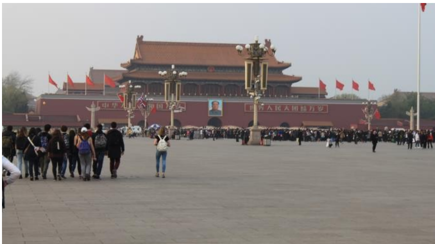
Découverte de la place Tian anmen, la quatrième plus grande place du monde (44ha).