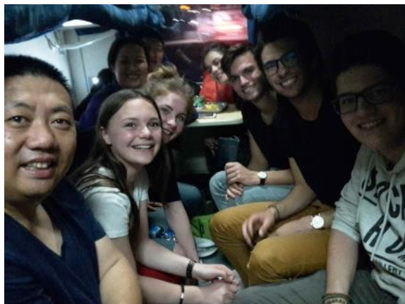
Soirée et nuit dans le train de Pékin à Xi'an puis de Xi'an à Suzhou. Une expérience à ne manquer sous aucun prétexte !