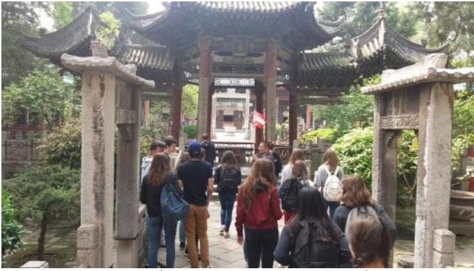
La Grande mosquée de Xi'an et l'armée de terre cuite datant de 210 av. J.-C.