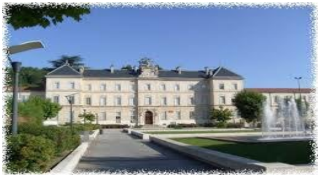
Lycée Dominique Villars - Gap